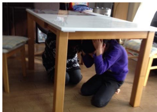
職場（左）や自宅（右）でのシェイクアウト訓練の様子