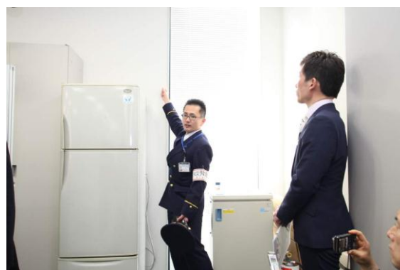
家具類転倒対策チェック