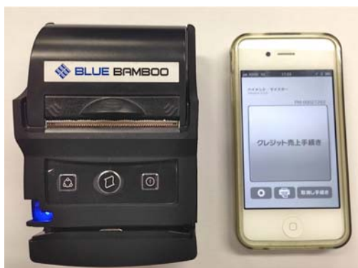
クレジットカード決済システムの使用機器

※ 「ペイメント・マイスター」は、日本クレジットカード協会の「スマートフォン決済の安全基準に関する基本的な考え方」に準拠した安心な決済システムです。